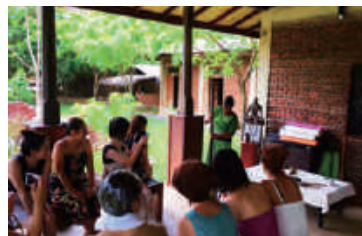
アーユルヴェーダトリートメント / アクティビティ